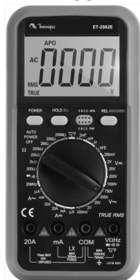
Imagem meramente ilustrativa/Only illustrative image/Imagem meramente ilustrativa/