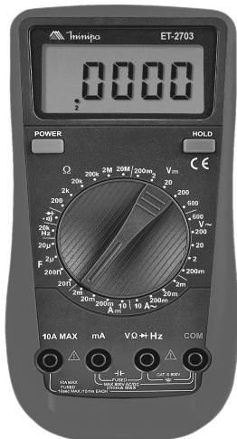
Imagem meramente ilustrativa. Only illustrative image. Imagem meramente ilustrativa.